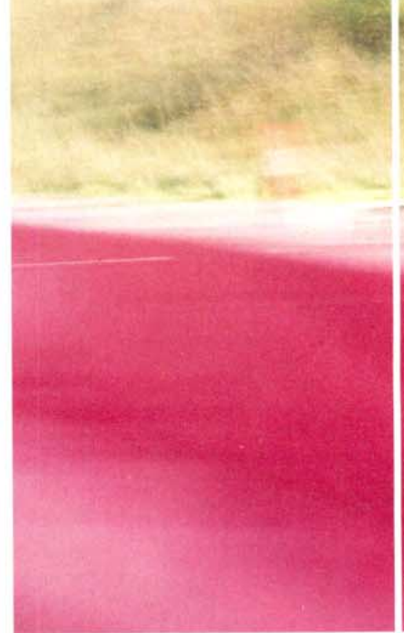
DER NEUE BUNDESVERKEHRSWEGEPLAN